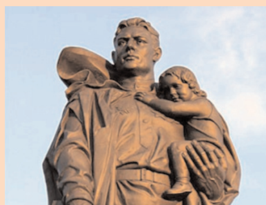
Монумент Радянському воїну-визволителю у Третюв-парку, Берлін