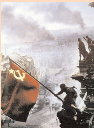
Прапор перемоги над Берліном

66 РОКІВ тому Радянські воїни розгромили звіряче гніздо фашизму, взяли штурмом Берлін, ліквідували рештки гітлерівської військової машини. Велич Перемоги над фашизмом у тому, що вона стала порятунком усієї цивілізації від знищення її кровавим мечем фашизму.